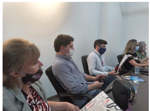
Londrina, 14 de outubro de 2021.